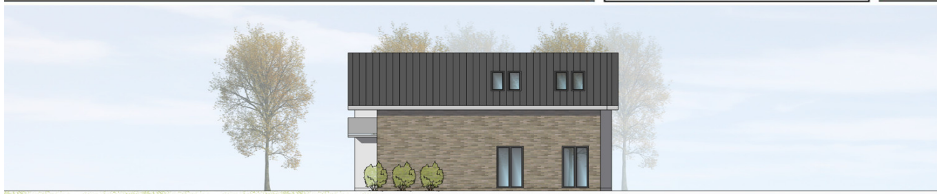
ANSICHT VON SÜDEN | M100